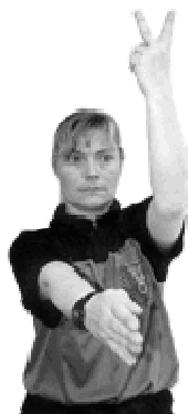
Exclusion de 2 minutes